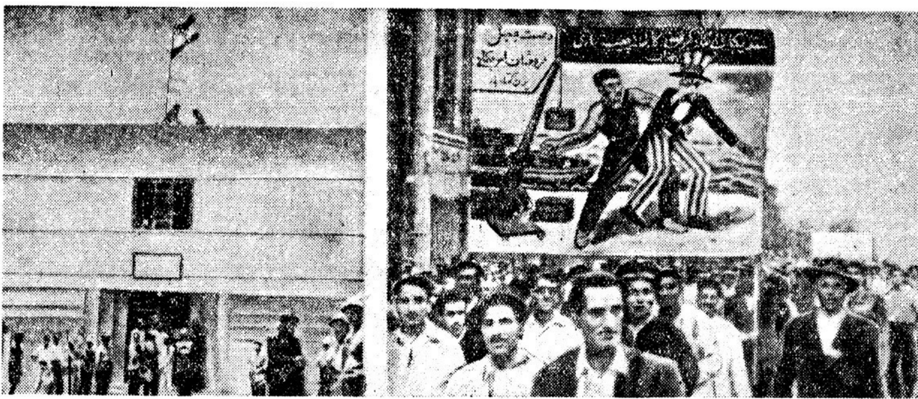
Иранский флаг поднят над зданием главной конторы бывшей Англо-Иранской нефтяной компании в Абадане (фото слева). Трудящиеся Ирана упорно борются против долготелого господства в стране Англо-Иранской нефтяной компании. Иранский парламент, как известно, в соответствии с требованиями народных масс принял закон о национализации нефтяной промышленности. Некоторые мероприятия по осуществлению этого закона уже проведены в жизнь.